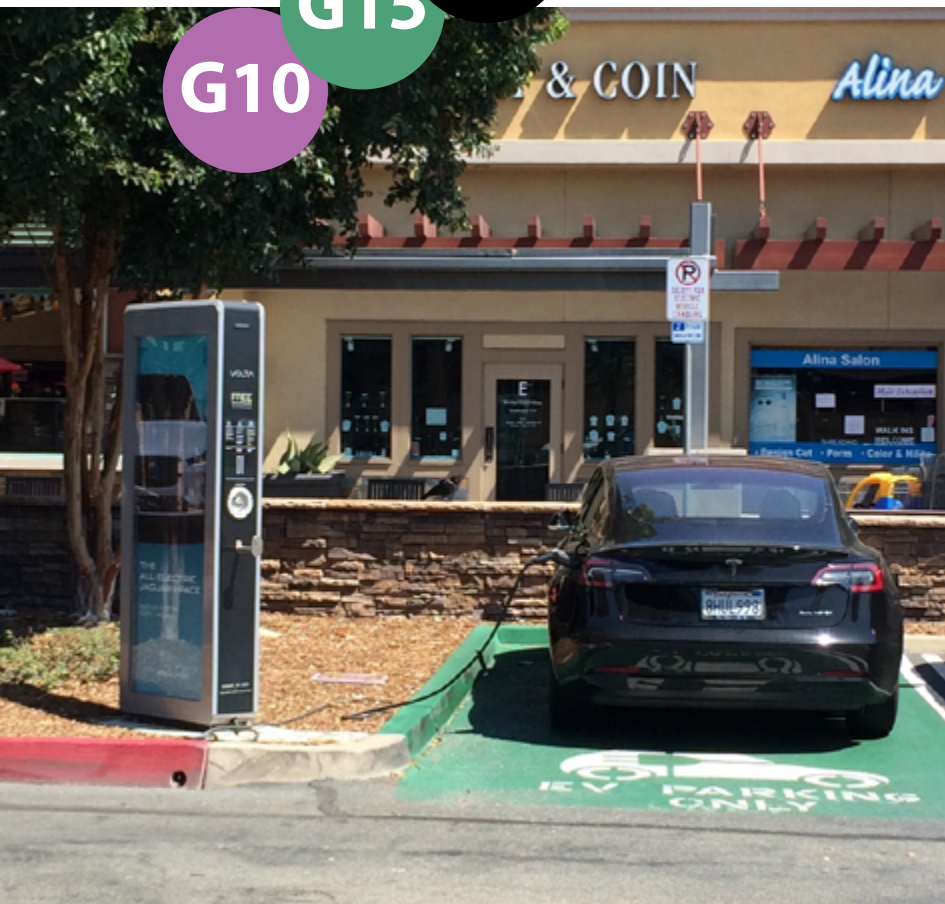
Charger с рекламной плоскостью, USA

Глобальный рынок электрических автомобилей расширяется на 50-60% в год. По темпам роста электромобильного (EV) рынка Украина занимает шестое место в Европе. Ожидается, что к 2027 г. отечественный парк EV увеличится в 8-10 раз, что создаст новые возможности, как для зарядного бизнеса, так для размещения точек общественного питания в формате ресторанов быстрого обслуживания. Но если это совместить, то кольцо, можно сказать, замыкается.