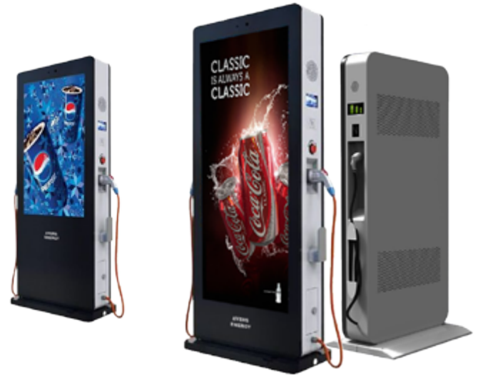
Зарядные станции AC/DC с использованием рекламных световых панелей 75" и TV UHD 4K дисплеев 55"

Но есть одно но, несмотря на большое количество зарядок, есть проблемы с пропускной способностью в одном, отдельно взятом месте. Риск наткнуться на занятое место очень велик, а с ростом количества электромобилей в стране, он не только не снижается, а напротив увеличивается, создавая проблемы для владельцев электромобилей. Именно поэтому в JY'S смогут подзаряжаться одновременно от 8-ми и более автомобилей, причем 4 из них, постоянным током (DC), мощностью 160kW и более, что на нашем украинском рынке уже начало появляться (VIWATT).