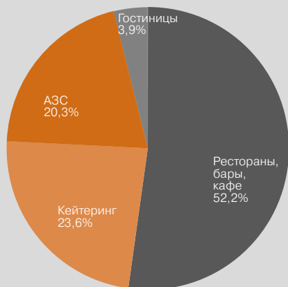
Структура рынка питания вне дома в Украине (%) Pro Consulting

По данным компании Pro Consulting 20,3% людей питающихся вне дома, утоляют голод или просто общаются за чашкой кофе на автозаправочных станциях. Это водители и их пассажиры, цифры преведены до пандемии. В развитых странах это устоявшаяся практика, например, в США более 50% дохода АЗС приходится на сопутствующие услуги. Анализ рынка свидетельствует, что в Украине понимание выгоды оборудования зон питания или даже открытия при АЗС целых ресторанов стало приходиться к владельцам только в последние годы. Сегодня уже более четверти работающих сетей автозаправок могут еще и накормить клиента. Тем более, это относится к зарядным станциям (ЭЗС), в которых время ожидания зарядки составляет порядка 20-30 минут, что делает совершенно естественным практику использования этого времени для „перекуса“. Фактически, строя ресторан на дороге, мы закрываем трафик в более чем 2/3 питающихся вне дома. (72,5%)